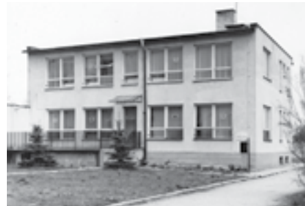
Přístavba prvního patra byla zkolaudovaná v roce 1982.