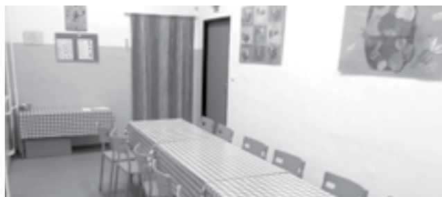
Ve školní jídelně byla kompletně vyměněna podlaha, včetně doplnění tepelné izolace a izolace proti vlhkosti, byly vyměněny židličky. Ve škole i ve školce byly namontovány na všechny radiátory termohlavice, některé radiátory byly vyměněny.