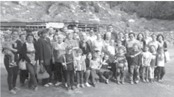
Výbor ČČK zorganizoval v květnu zájezd do Jeseníků.