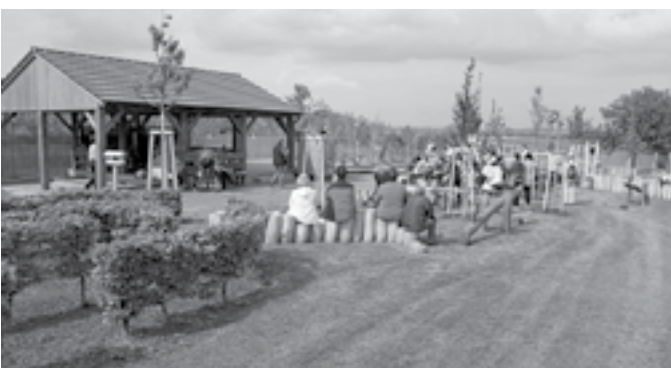
V roce 2016 byla zrekonstruovaná zahrada MŠ v přírodním stylu.