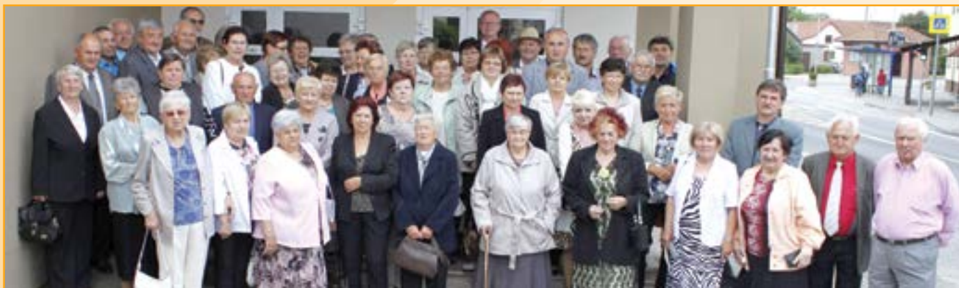
Společná fotografie rodáků - jubilantů ročníku 1927, 1932, 1937, 1942, 1947, 1952 a 1957.