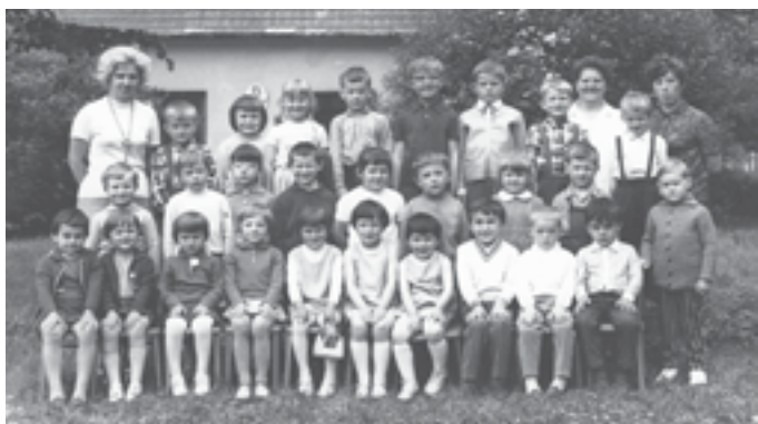
Jedna z posledních fotografií před starou mateřskou školkou