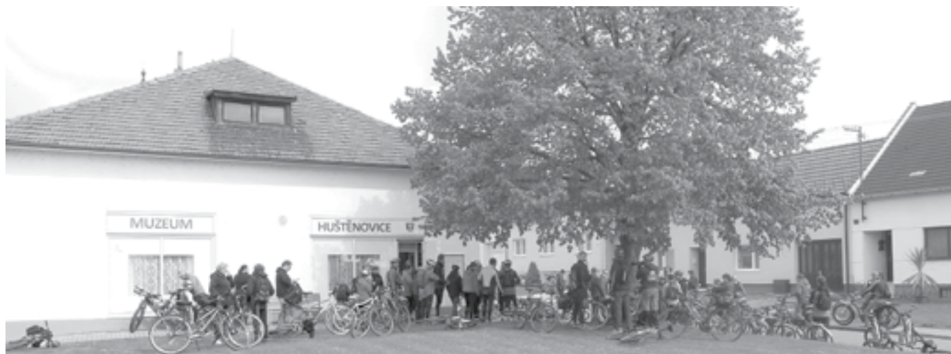
Při jarní akci Na kole vinohrady Uherskohradištska navštíví naše muzeum až stovka cyklistů.