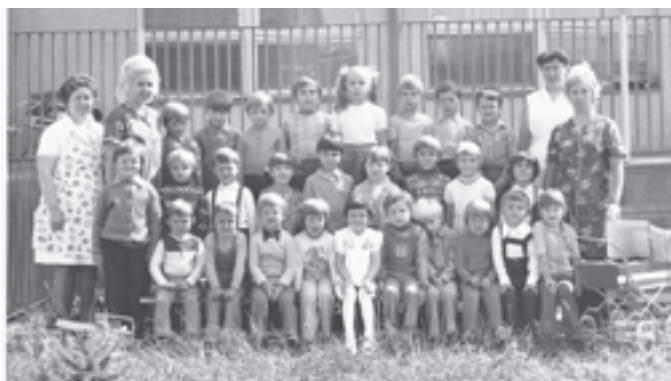
První fotografie před budovou nové školky.