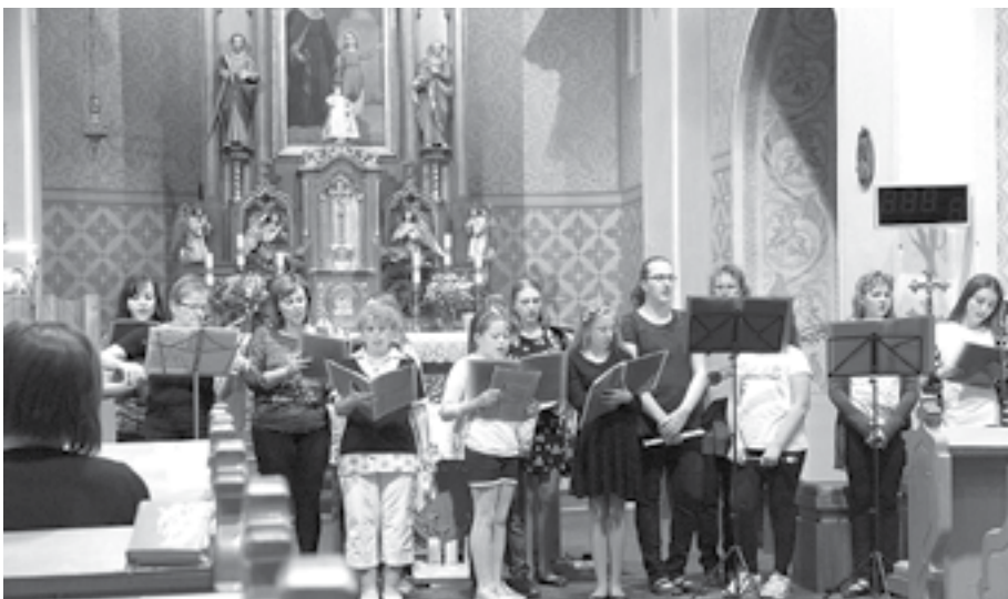
Koncert místní scholy.