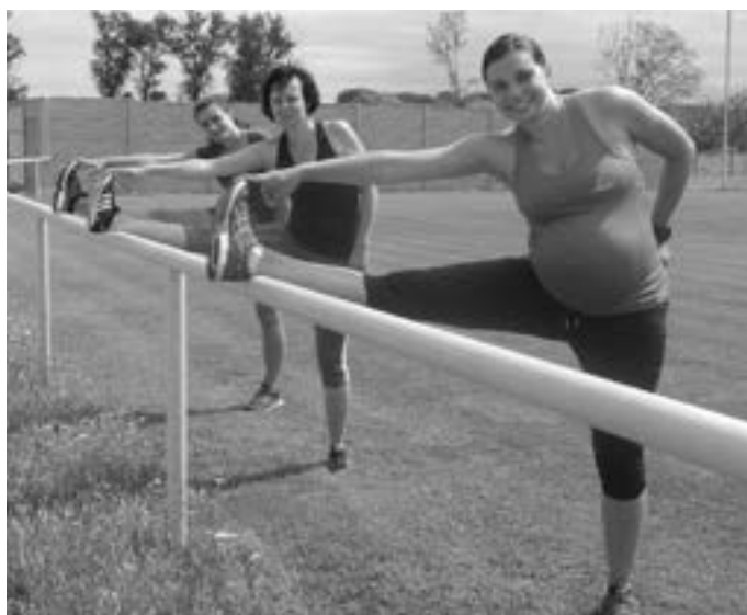
Při cvičení nás nic neomezuje.