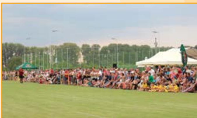
Ochozy byly plné přihlížejících diváků.