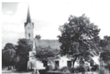
Budova mateřské školy do roku 1972. Dnes tu stojí budova obecního úřadu.

Přišel přelomový rok 1989 v naší společnosti, který s sebou přinesl dosud netušené možnosti, jako svobodu rozhodování, vznik soukromého sektoru, podnikání, možnost cestovat, pracovat a studovat v zahraničí, ale i nezaměstnanost a pokles porodnosti. Bez úhon jsme přečkali i ničivou povodeň v létě 1997. Stoletá voda připravila o všechno mnoho rodin, ale i státní sektor. Většina škol, pokud nebyly zaplaveny, se proměnila na centra pomoci postiženým záplavami.