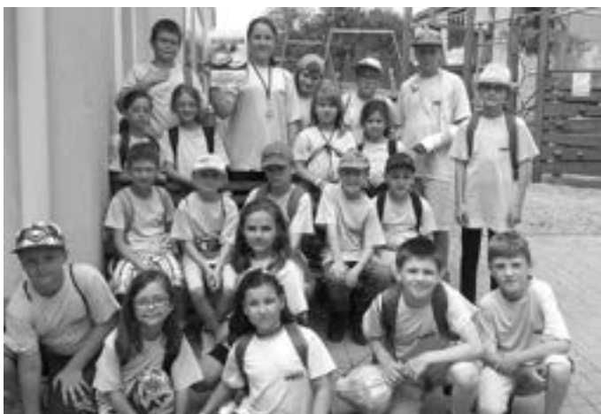
Žáci se účastnili turnaje ve florbalu ve Spytihněvi.