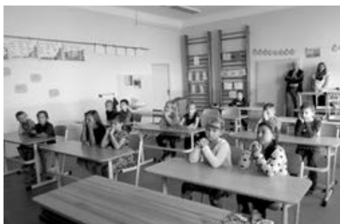
Žáci 2. a 3. ročníku.