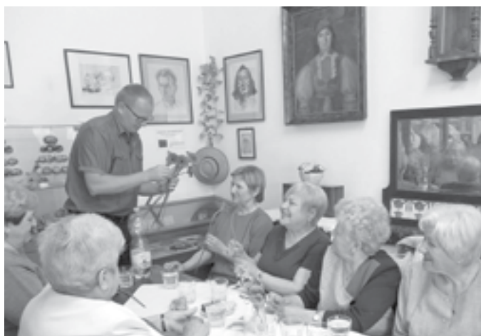
Starosta Aleš Richtr předává ženám květiny u příležitosti Dne matek.