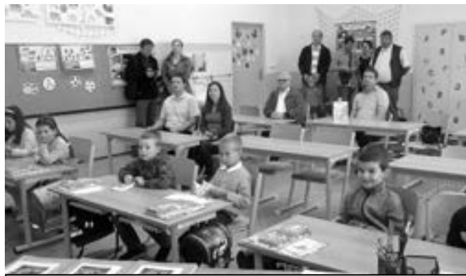
Prvňáčci poprvé ve školní lavici.