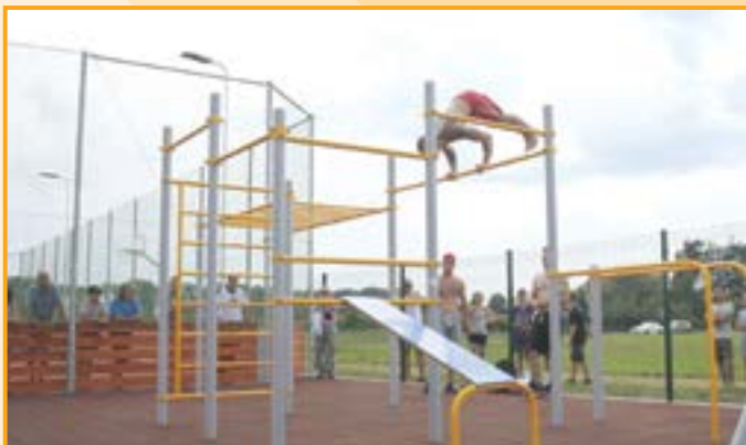
Sportovci ze Street Workout Nitra předvedli, co se dá na posilovacích prvcích cvičit.