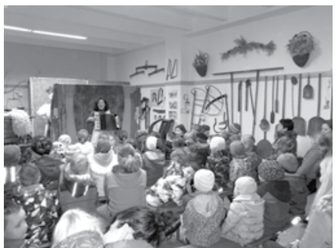
Děti s lampióny obešly náves a v muzeu na ně čekalo loutkové divadlo. Nechyběl ani ohňostroj.