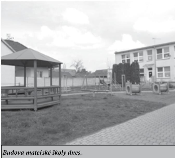
Budova mateřské školy dnes.

pro mladé rodiny, se rodilo hodně dětí a nebyl problém s naplněností tříd.