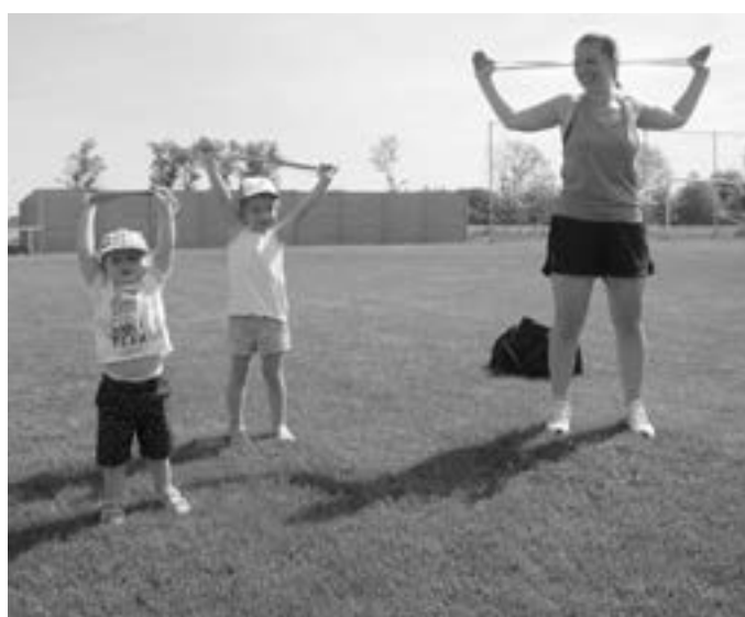
Do cvičení se zapojují také děti.