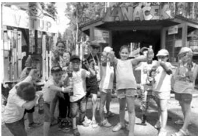
Odpočinout si od školních povinností byli žáci v ZOO Olomouc.