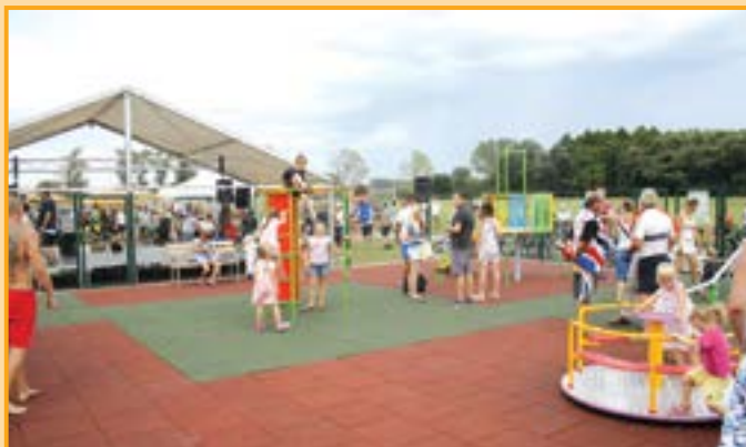
Děti napodobovaly „siláky“ z Nitry.