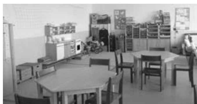
Interiér školní družiny.

Nebudou chybět tradiční a oblíbené pracovní listy, jejichž