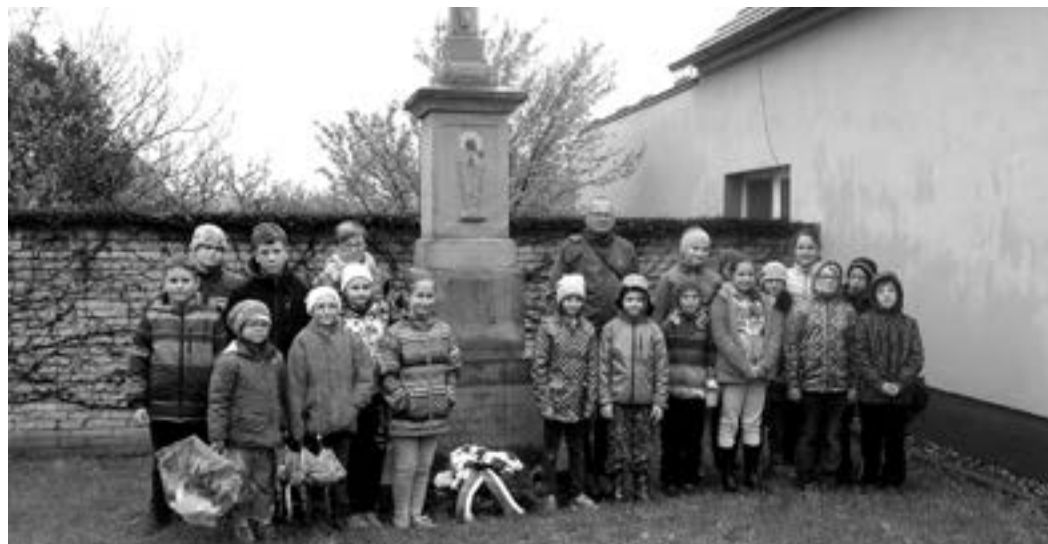
V předvečer osvobození obce je tradičně kladena kytice květů ke kříži na dolním konci.