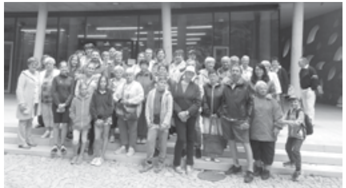
Muzejní spolek zorganizoval koncem srpna zájezd na Macochu a do poutního místa Křtiny.