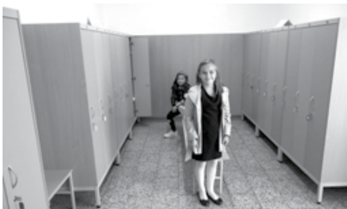
O letošních prázdninách jsme ve škole zrekonstruovali šatny, každý žák bude mít vlastní skříňku.

finanční účasti na spolufinancování 5% spolupodílu na těchto projektech s tím, že konkrétní výše spolupodílu připadajícího na obec Huštěnovice bude propočtena v poměrné výši dle počtu žáků příspěvkové organizace Základní škola a mateřská škola