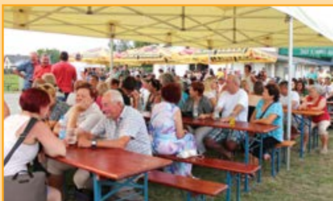
Sportovní odpoledne si nenechala ujít spousta domácích i přespolních návštěvníků.