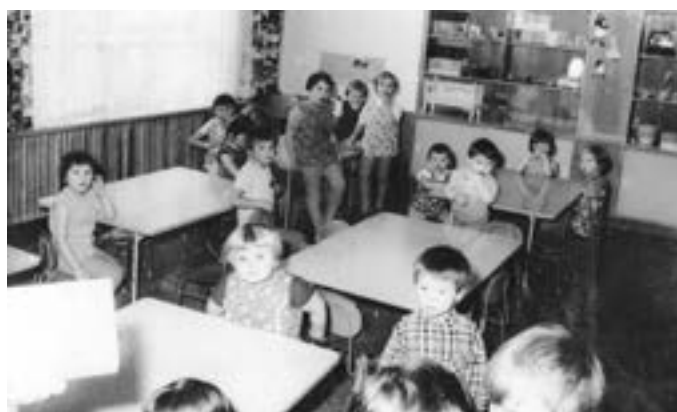
Herna v přízemí školky.