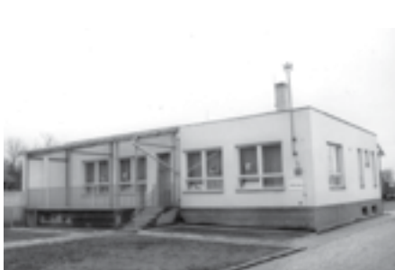
Nová budova mateřské školy byla slavnostně otevřena 1. října 1972.