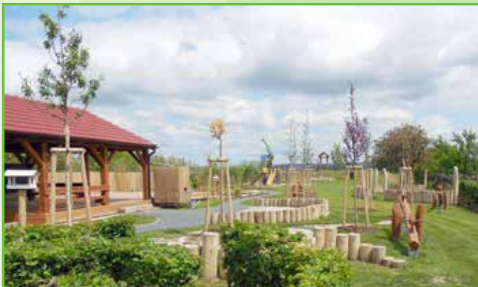
Zahrada v přírodním stylu v mateřské školce /2015/.