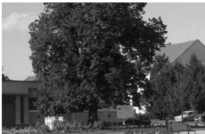
Švehlova lípa z roku 1934 za obecním úřadem.