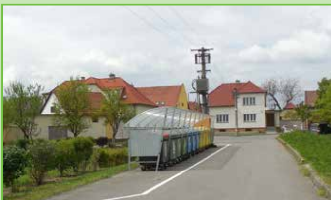
Byly navýšeny počty kontejnerů a provedeno zastřešení /2015/.