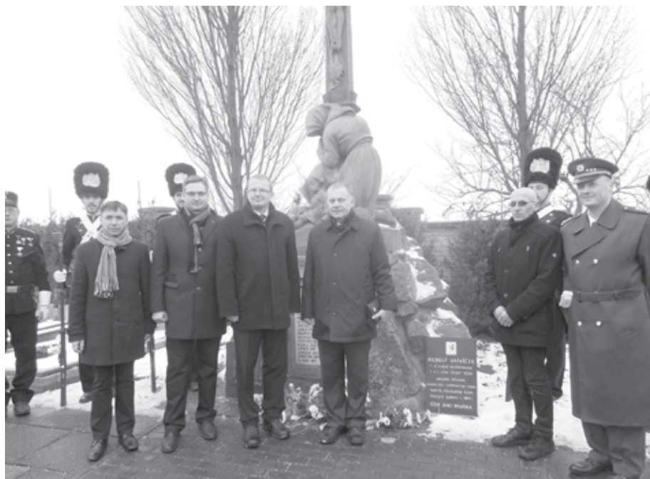
9. ledna 2016 byla generálu Rudolfu Králíčkově v rodných Huštěnovicích odhalena pamětní deska za vojenských poct na místním hřbitově, u Památníku padlým obětem v 1. sv. válce, u příležitosti jeho sedmdesátiletého výročí úmrtí.

V rodině železničáře se narodil v Huštěnovicích 19. ledna 1862 Rudolf Králíček, který roku 1880 zahájil studium na kadetní škole v Košicích. Po skončení studia, díky svým schopnostem a vzorné službě,