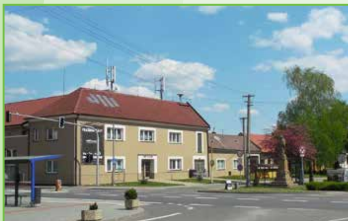
Světelná signalizace na obou přechodech pro chodce, nový nátěr kulturního domu, dům č.p. 62 s novou fasádou /2015/. V KD byly přebroušeny a přelakovány všechny dřevěné podlahy /2016/.