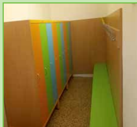
Nové šatny ve škole, kde každý žák má svou uzamykatelnou skříňku /2017/.