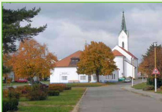
Taky budova, známá jako dům služeb, dnes muzeum, má novou fasádu /2016/.