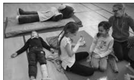
Zdravotnické školení děti berou jako hru, přesto vážně.