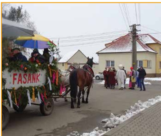
Maškary prošly celou vesnicí, kapela je doprovázela na voze.