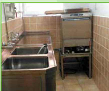
Ve školní jídelně máme nové kuchyňské nerezové vybavení, byla zrekonstruovaná výdejna obědů /2016/.