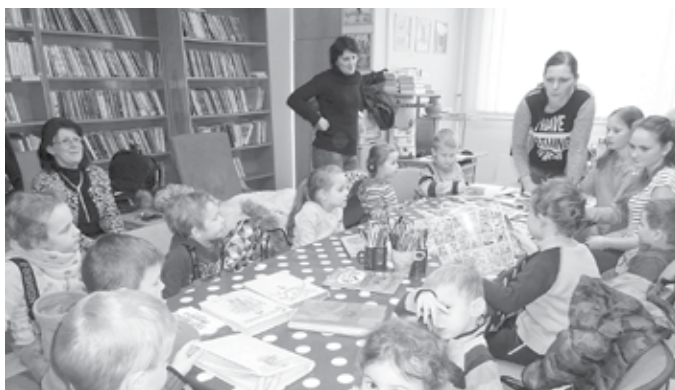
Návštěva knihovny - Děti z mateřské školky besedovaly nad knížkami Josefa Lady.