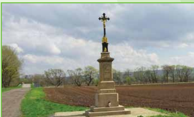
Zrestaurovaný kříž u Bařova kanálu /2016/.