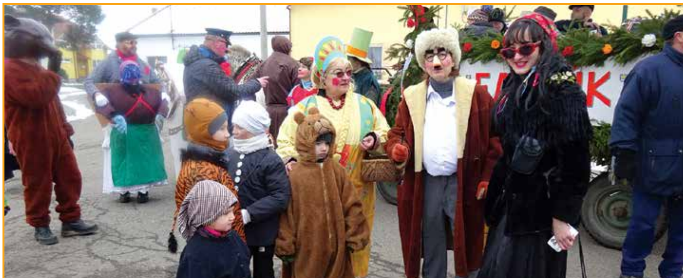
Letošní fašank si užívaly děti i ženy v přestrojení za kominíka, medvěda či Marfušku z Mrazíka.