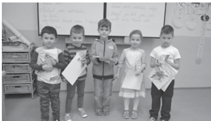
Předškoláci se zúčastnili v základní škole recitační soutěže.