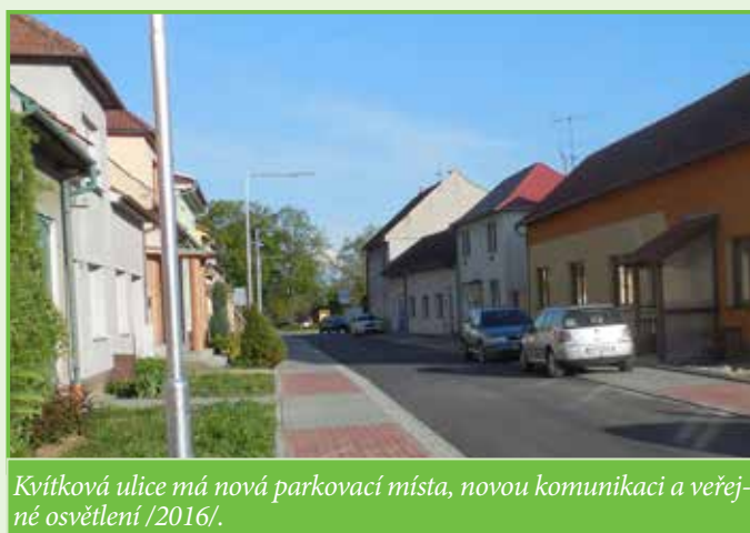
Kvítková ulice má nová parkovací místa, novou komunikaci a veřejné osvětlení /2016/.