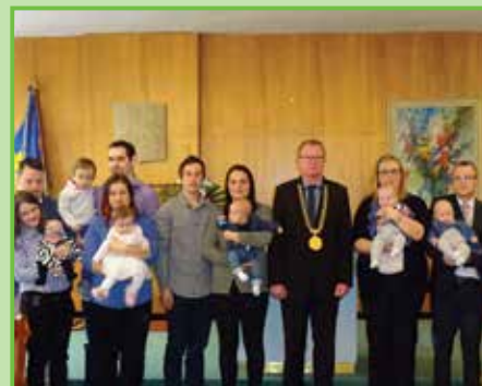
Společná fotografie se starostou obce.

Periodický tisk územního samosprávného celku