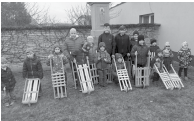
Dolňané u kříže na dolním konci.