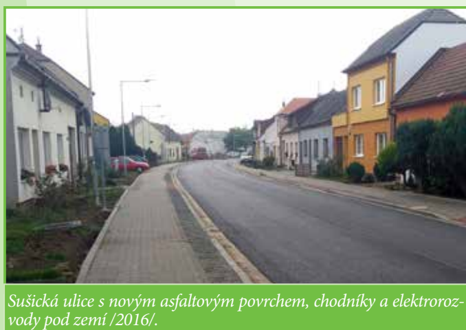
Sušická ulice s novým asfaltovým povrchem, chodníky a elektrorozvody pod zemí /2016/.