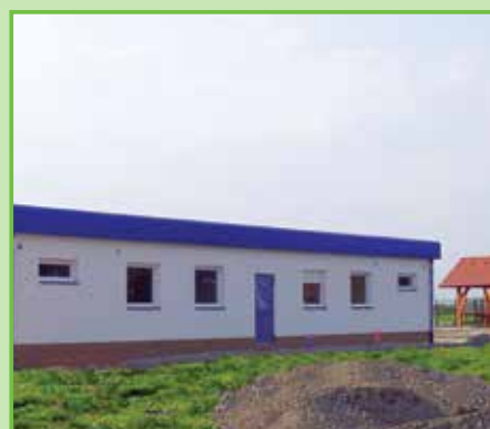
Montáž šaten a sociálního zázemí sportovního areálu. Po kompletaci interiéru přišla řada na barevnou fasádu.