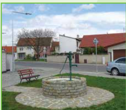
V Chaloupkách se postupně upravuje vzhled prostranství, první na řadu přišla studna.