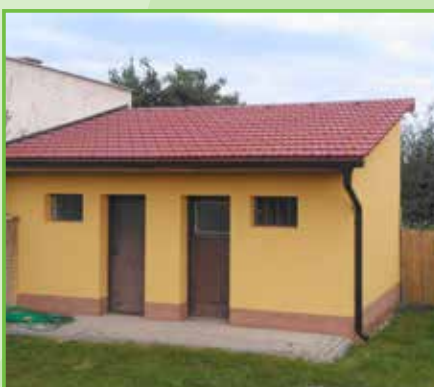
Zahradní domek v mateřské školce v novém šatu /2016/.