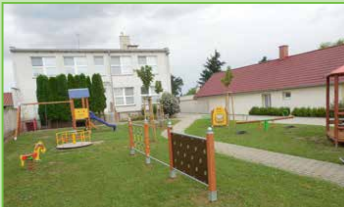
Nové hrací prvky před mateřskou školkou jsou volně přístupné veřejnosti /2015/.