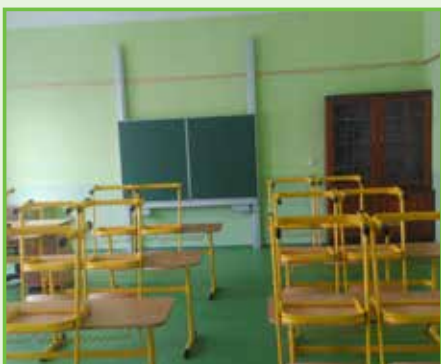
V přízemí základní školy byly v učebnách vyměněny podlahy, nová výmalba, ve třídě je interaktivní tabule pro výuku žáků /2016/.