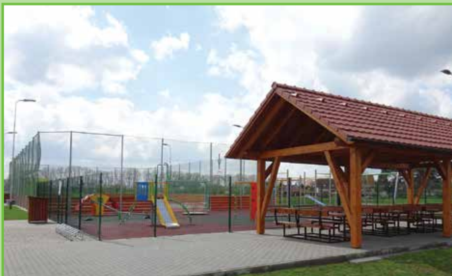
22. července 2017 při oslavách 85. výročí TJ SOKOL bylo slavnostně otevřeno víceúčelové sportoviště v Olší. Vedle sportoviště vyrostla krytá pergola s posezením.

Rok 2018 - V letošním roce byla zahájena rekonstrukce budovy sportovního areálu. Budova byla v havarijním stavu, bylo rozhodnuto o jejím stržení a na stejném místě bude vybudováno nové zázemí sportovního areálu z prefabrikovaných buněk. Nová budova bude sloužit nejen TJ Sokol, ale i všem návštěvníkům sportovního areálu. U dětského hřiště je dřevěný přístřešek s venkovním posezením. Byly zahájeny pozemkové úpravy.