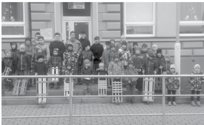
Společná fotografie při velikonočním vyhrkávání.