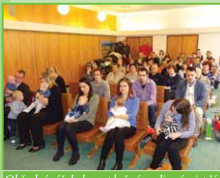
Obřadní síň byla zaplněná rodinnými příslušníky.