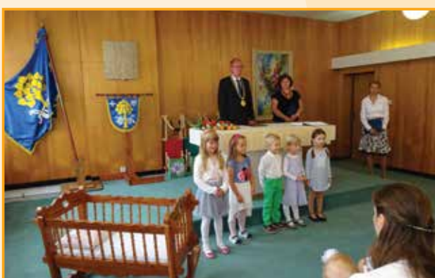
Své budoucí kamarády přivítaly děti z mateřské školy