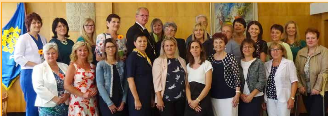
Společná fotografie bývalých a současných pedagogů a zaměstnanců základní školy a mateřské školy.