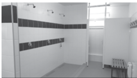
Sprchovací místnosti s WC pro hosty.