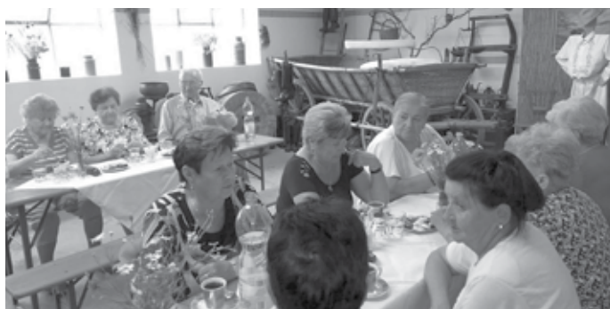
Nedělní besedování v muzeu.

9. ročník lyžařského zájezdu do Ski areálu Bílá v Beskydech se uskuteční 3. února 2019. Přihlásit se můžete v kanceláři obecního úřadu a současně zaplatit účastnický poplatek, který činí 150 Kč na osobu. Děti do 10 let zdarma, ale musí být přihlášeny.