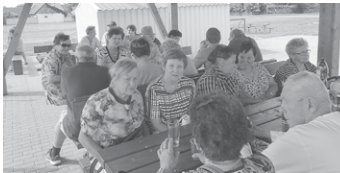
Posezení na hřišti s prohlídkou nového sociálního zázemí pro sportovce.