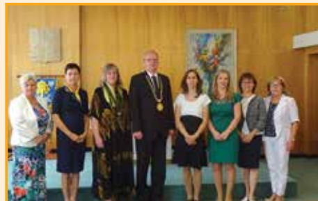
Pedagožky a zaměstnankyně základní školy ve školním roce 2017/2018.