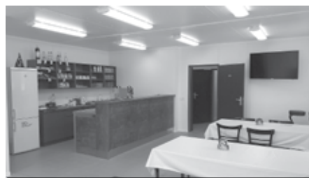
Společenská místnost s bufetem.