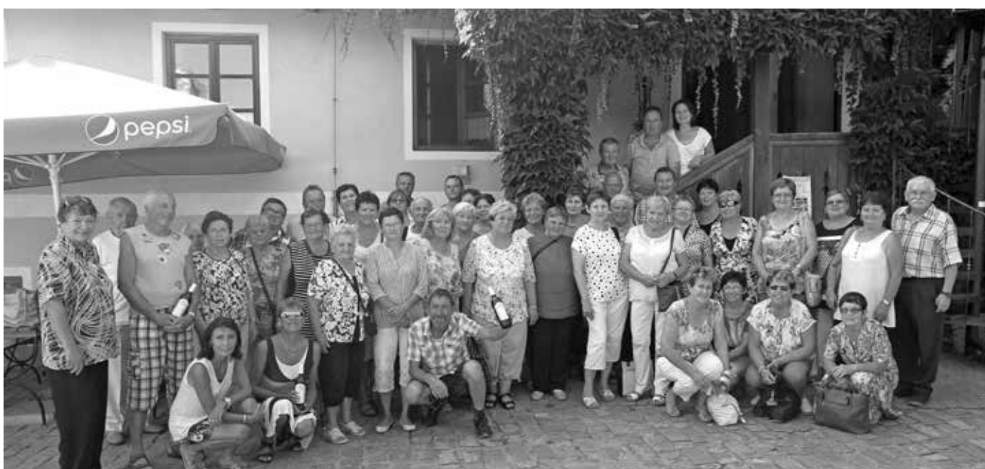
Muzejní spolek zorganizoval v srpnu zájezd do Mikulova a do Lanžhota k Osíčkům na pěknou slováckou písničku.