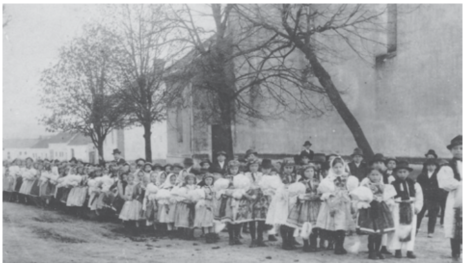
Průvod krojované mládeže 28. října 1919, kdy byla vysazena Lípa svobody.