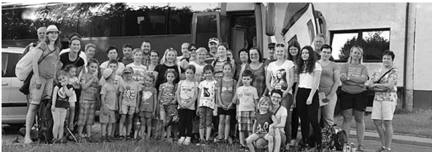
V květnu členky Českého červeného kříže uskutečnily zájezd do Kopřivnice a Štramberku.