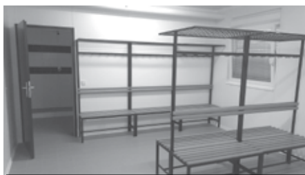
Šatna pro domácí mužstvo.