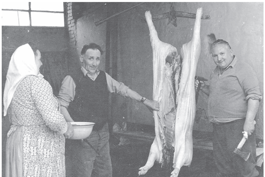
Moja maminka, kmotr a otec.