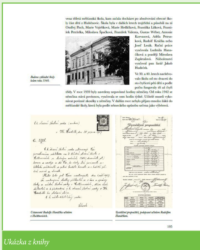
Ukázka z knihy