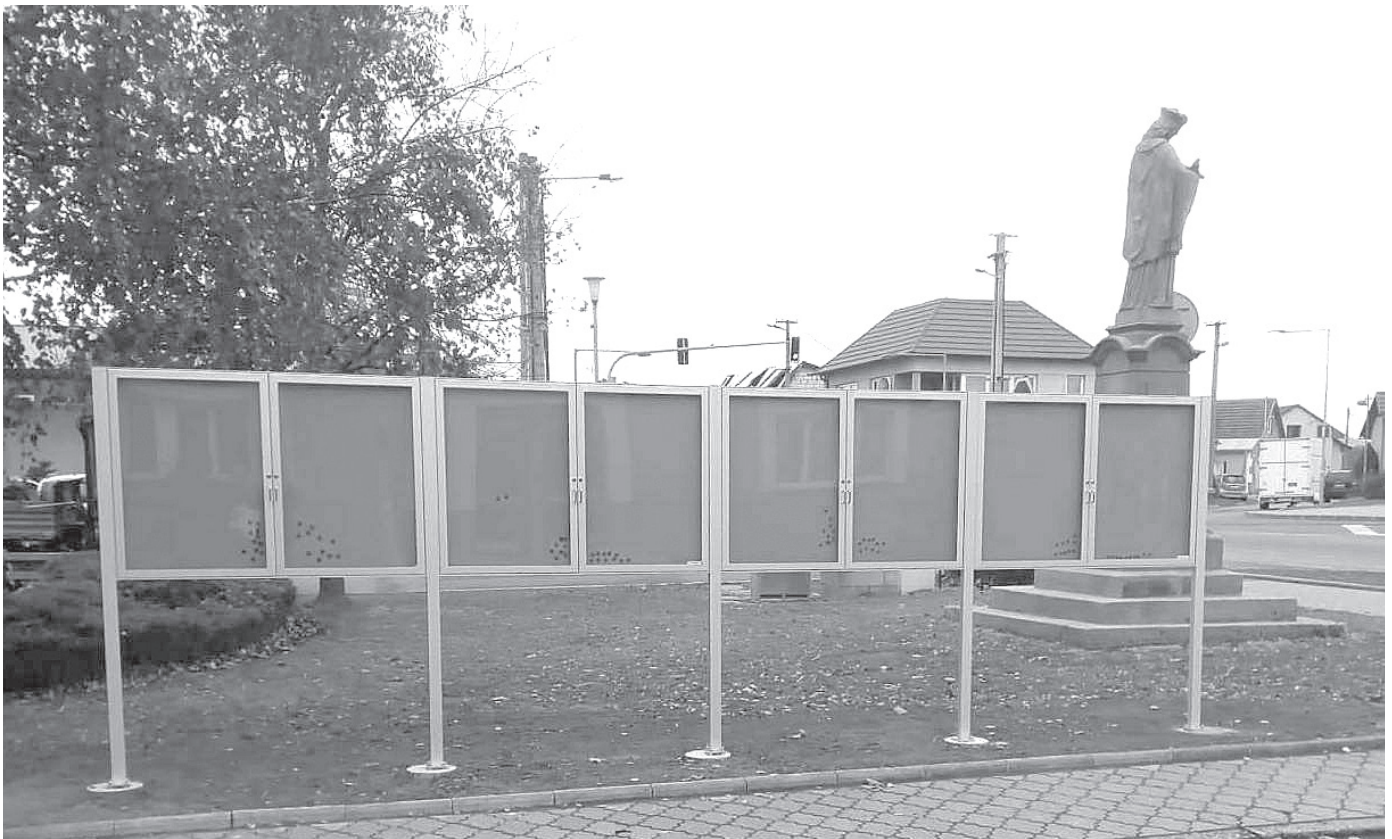
Na návsi byly koncem roku vyměněny informační skříňky. Jsou rozděleny mezi místní organizace a spolky.

Telefon pomůže v případě zajištění péče o pečujícího nebo o domácího mazlíčka.