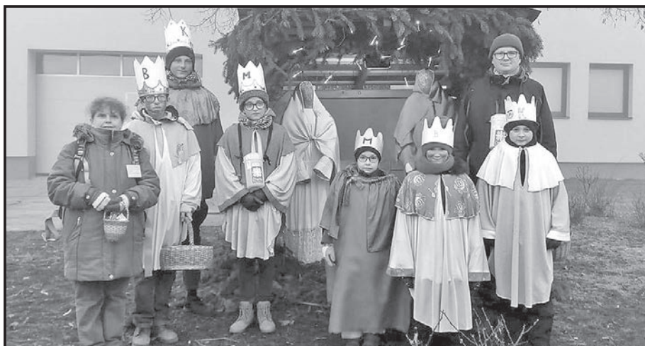
Letošní dvě skupinky Tří králů vybraly v Huštěnovicích částku 30 885 Kč.