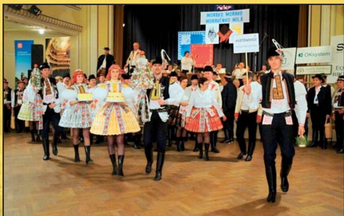
Moravský ples v Praze