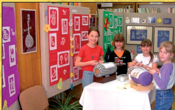
Výstava paličkové krajky