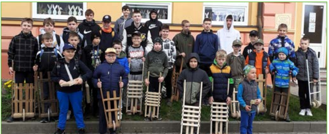
Horňané a dolňané při vyhrkávání