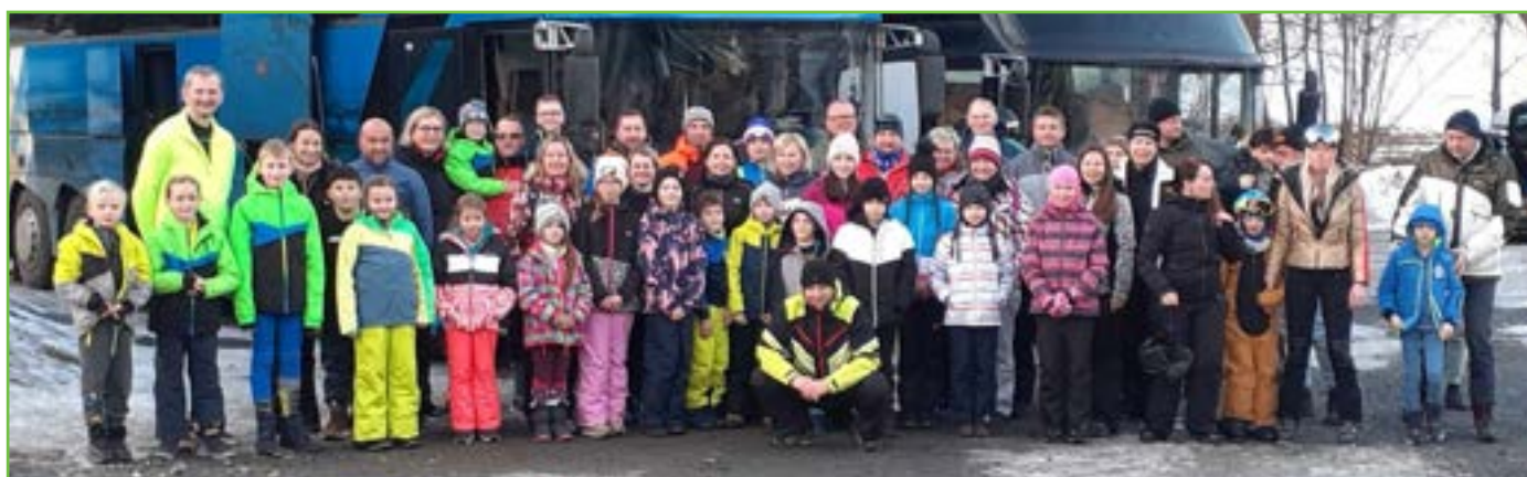
Lyžařský zájezd do Ski areálu Karlov jsme absolvovali pro velký zájem dvěma autobusy.