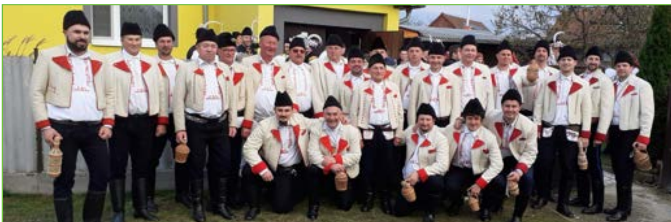
Krojování šohajé – kroj ženatých mužů