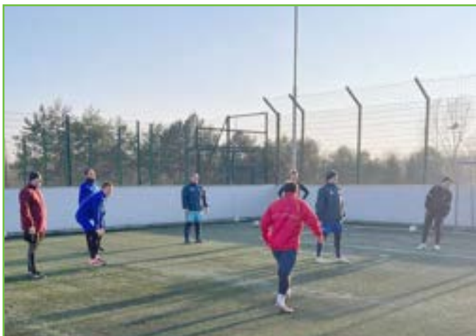
Soustředění na Břestku