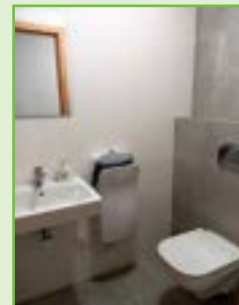
Zrekonstruovaný vestibul OÚ a nové sociální zázemí.