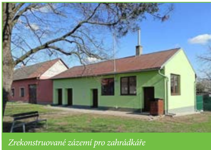
Zrekonstruované zázemí pro zahrádkáře