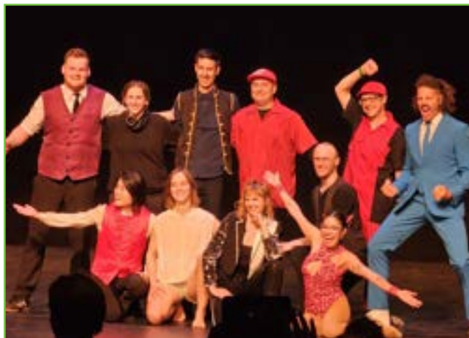
Z vystoupení v Palo Alto v Kalifornii