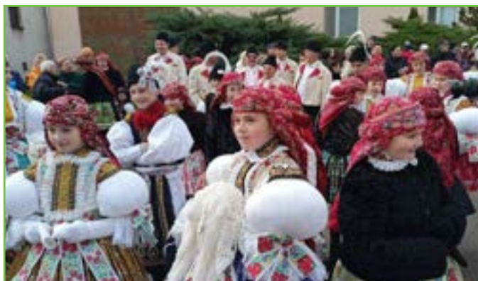
Nejmłodší krojovaná děvčata