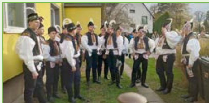
Před domem stárek