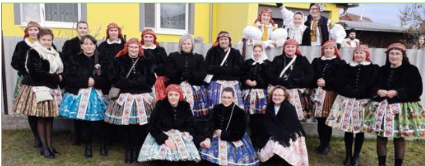
Krojovaná děvčata – kroj vdaných žen