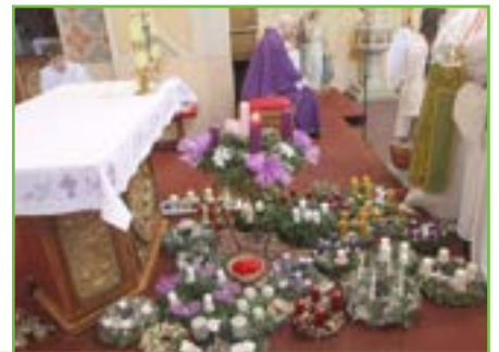
NÁVŠTĚVA SVATÉHO MIKULÁŠE po mši svaté 3. prosince. V tuto neděli se žehnaly na začátku mše svaté také adventní věnce.