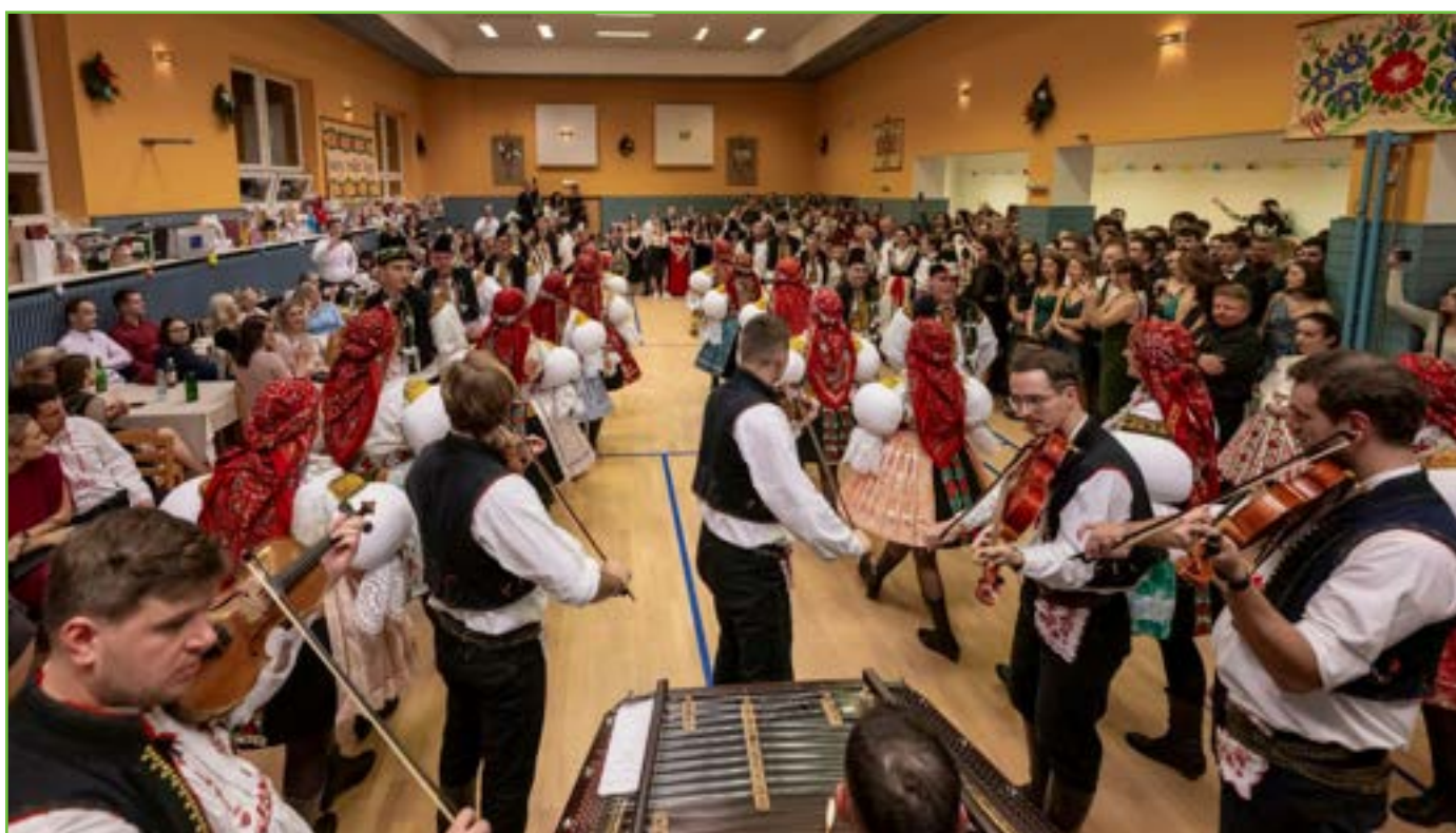
Cimbálová muzika Harafica je součástí našich hodů už od roku 2006.