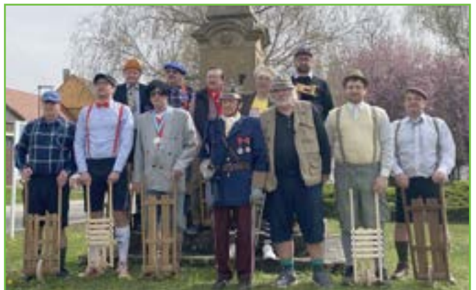
Kdo si hraje, nezlobí