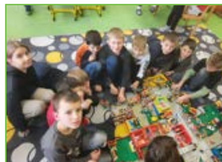
Máme rádi Lego