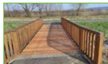
Zaměstnanci obce opravili mostek přes potok